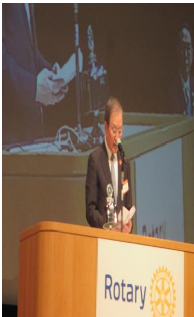
山地会長 富山南 RC